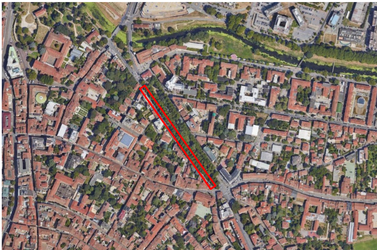
Figura 1: area oggetto di sopralluogo

Si riporta di seguito un'immagine che delinea l'area oggetto di sopralluogo.