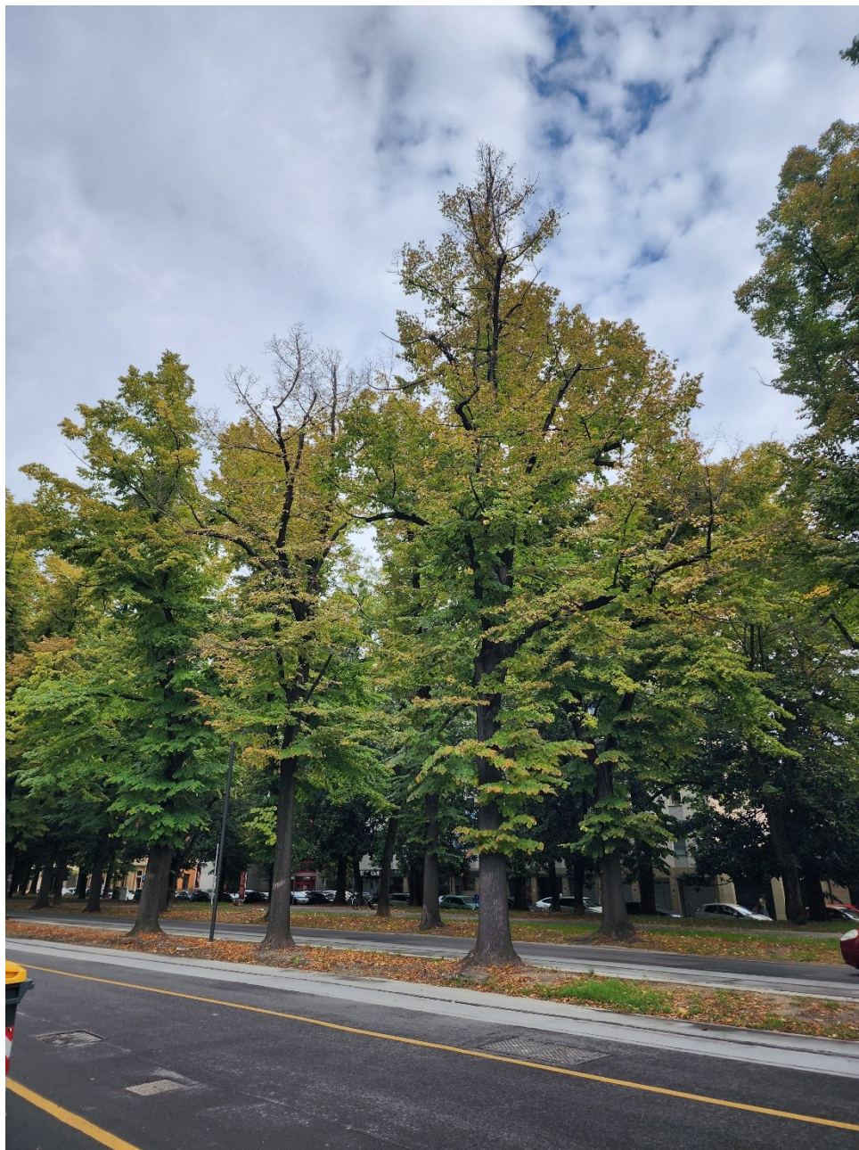
Figura 4: tigli in deperimento

Vengono di seguito evidenziati in cerchi rossi alcuni dei rami secchi rinvenuti dal sopralluogo speditivo.