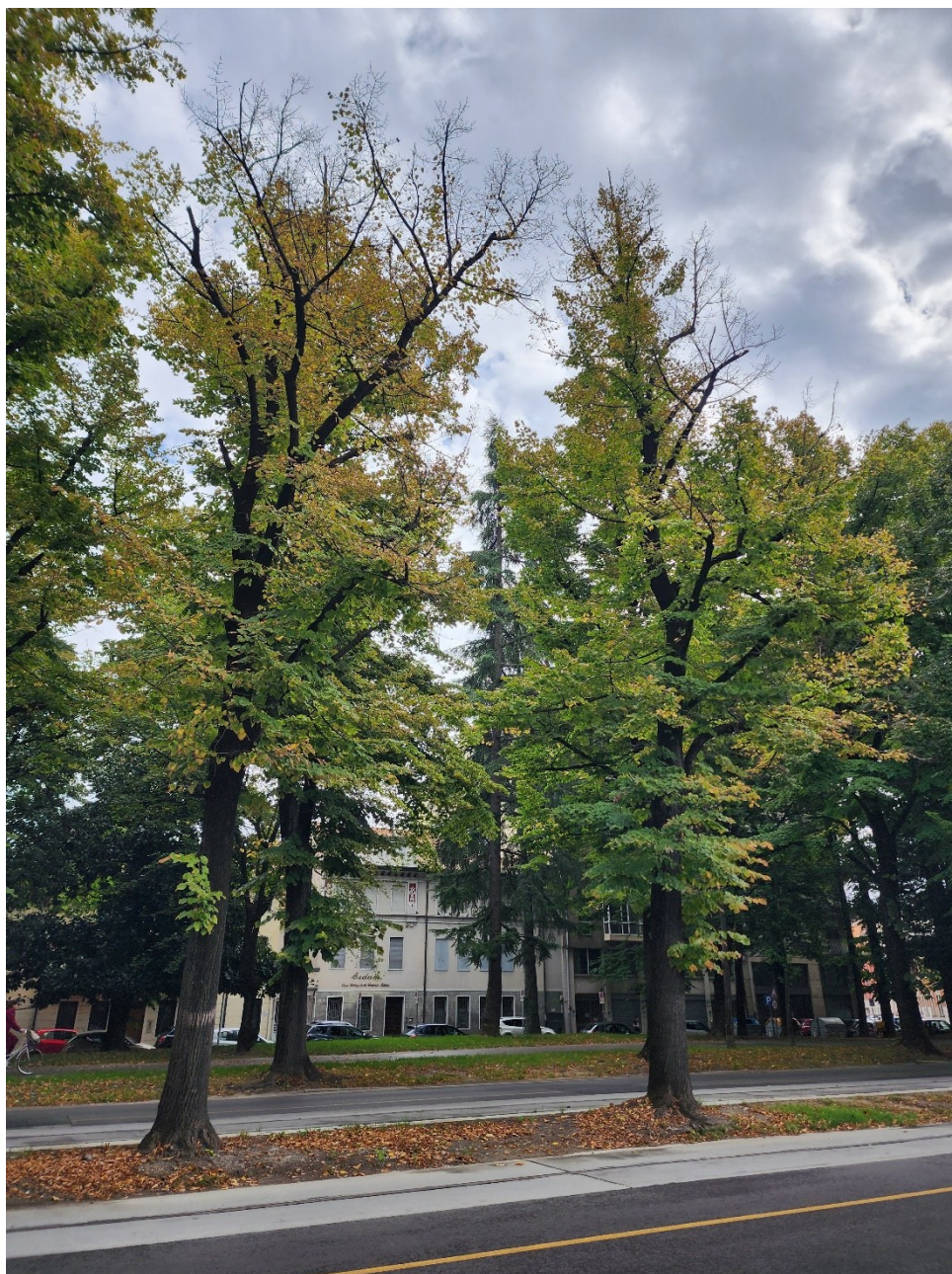
Figura 5: tigli in deperimento